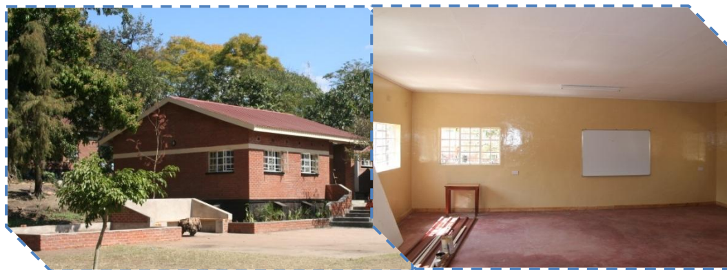
Foto boven: schoolblok 5 in aanbouw. Onder: Schoolblok 2B en schoolblok 1

Schoolblok 2b en 5 zijn eind juli gereed gekomen. Schoolblok 2B bestaat uit twee klaslokalen voor kinderen uit Graad 5 en 6. Schoolblok 5 is één groot lokaal voor de kinderen uit Kindergarten. Dit is meestal de grootste klas van de school, en heeft daarom ook een groter lokaal gekregen.